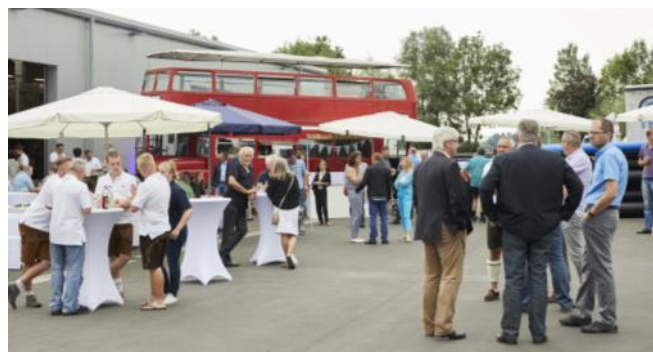
Doppeldeckerbus mit Außenbereich - Zeit für lockere Gespräche ...