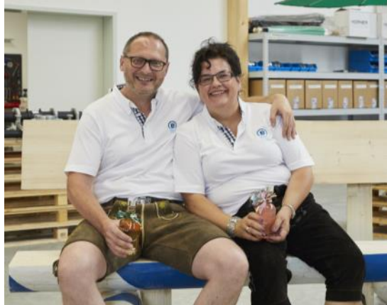
Ruhe vor dem Sturm - gleich die neue Bank ausprobieren ...

links: ein Geschenk von den Mitarbeitern: eine selbstgeschreinerte Holzbank in weiß-blau mit einem kleine „Schnups“ zum Feiern!