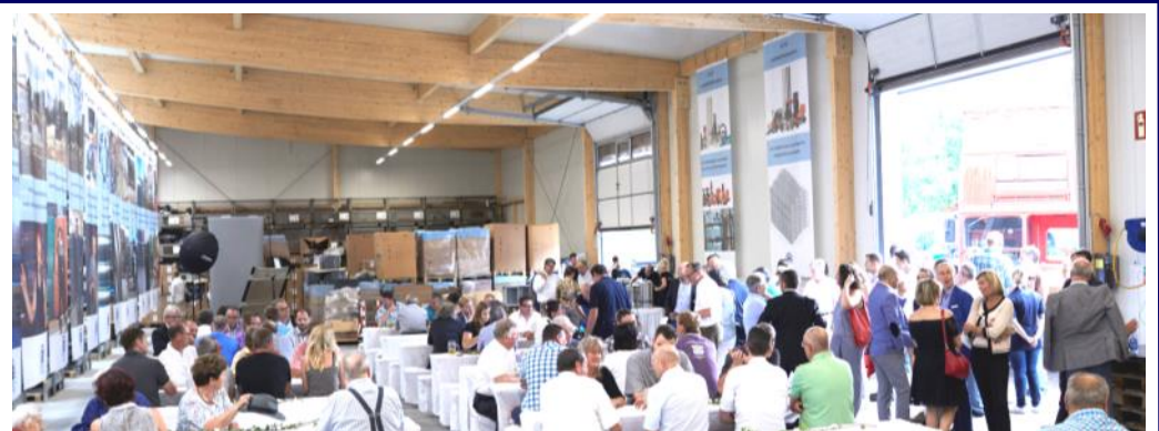
Unsere mit PE TEC Fahnen (15 humorvolle PE TEC Weisheiten) geschmückte Halle mit unseren Gästen

Der Wartungsservice für Schweißmaschinen ergänzt diesen Bereich optimal und wirkt synergetisch.