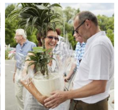
... Und Blümchen durften nicht fehlen !