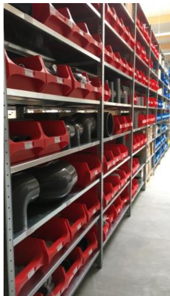
Rohre und Formteile aus PVC, auch transparent!

In Windeseile ... wurde unser Lagersortiment ergänzt: