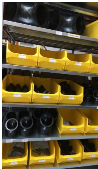
Formteile PE kurz und PVDF-Rohre

... Rohre und Formteile in PE, PP, PVC und PVDF