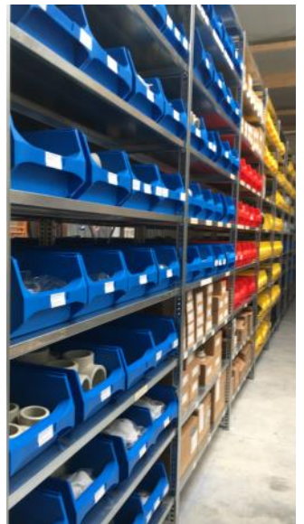
Rohre und Formteile aus PP

... damit wir - für Sie - sofort lieferfähig sind!